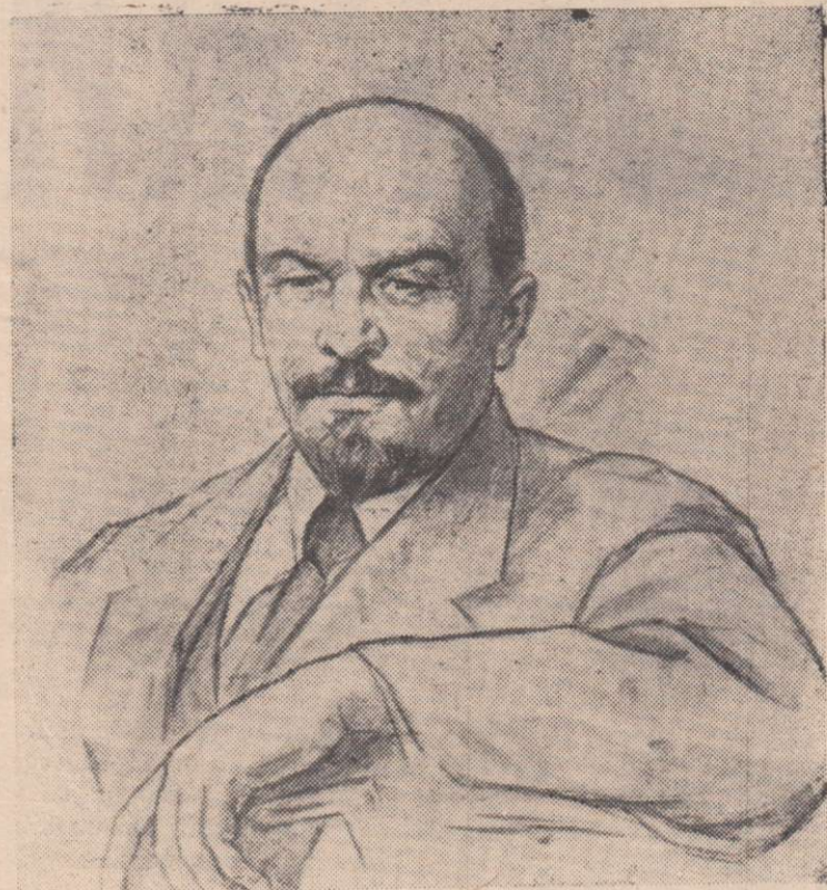
«Владимир Ильич Ленин в графике» — так называется выставка, открытая в Харьковском областном доме художественной самодеятельности. Авторы картин показывают в разные периоды его жизни и деятельности.

Каждая, даже мимолетная встреча, каждое ленинское слово врезались в память, в сердце, озаряли мою жизнь, прибавляли энергии в борьбе за победу великого дела.